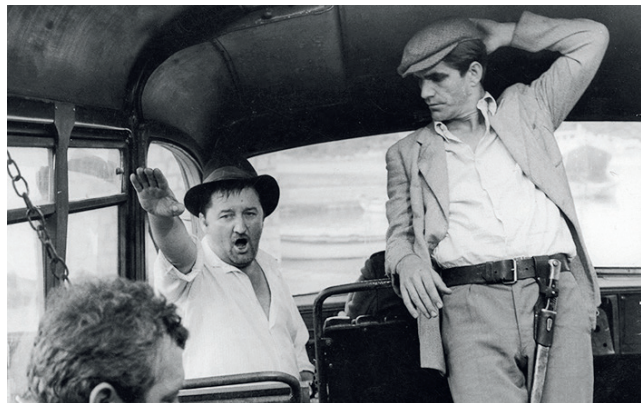
U filmu »Okupacija u 26 slika«